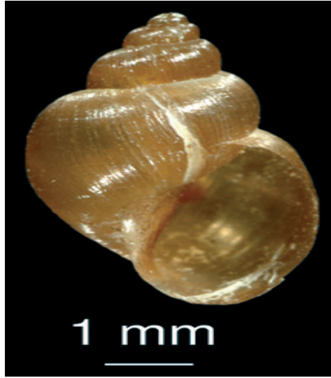
Şekil 1. Lymnea truncatula ( Galba truncatula )(Anonim 1).

F. hepatica 'nın en önemli ara konaklarının Lymnea cinsinden salyangozlar olduğu, Avrupa'da ve kuzey Asya'da Lymnea truncatula , Afrika'da Lymnaea natalensis 'in, Amerika'da Lymnaea bulimoides techella , Avustralya'da Lymnaea tomentosa 'nın ara konak olarak rol oynayan gastropodlar olduğu bildirilmiştir. DNA dizi analizi ve izoenzim çalışmaları bir Avrupa türü olan Lymnea truncatula 'nın Güney Amerika'da bulunduğunu göstermekle kalmayıp, Bolivya Altiplano'da fasciolosis bulaşımında ara konak olan tek salyangoz cinsi olduğu gösterilmiştir (Şekil 1) (Kendall, 1965; Mas Coma ve ark., 1999a).