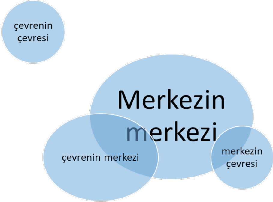
Şekil 1: Galtung'a göre merkezin merkezindeki ülkelerin ve çevrenin merkezindeki ülkelerin iletişim biçimi

lıdır ve merkezin merkezindeki ülke veya ülkelerin kontrolündedir. Merkezin merkezindeki ülkelerin ise birbiriyle iletişimi en sık görülen ilişki biçimidir. Örneğin; Avrupa Birliği (A.B.) üyesi ülkelerin özellikle AB-15 ülkelerinin birbiriyle iletişimi yoğundur. Merkezin çevrenin merkezindeki ülkelerle iletişimi 2. dereceden ilişki biçimidir. Uluslararası örgütlerde çok taraflı toplantılar yapılsa da bu toplantıları düzenleyen merkezin merkezindeki ülkelerdir. Merkez-çevre iletişiminde yine feodal bir iletişim yapısı görülmektedir. Her iki taraf arasında sorunların çözümü ya da diplomatik dilde sorunların masaya yatırılması öncelikle merkezin merkezindeki ülkelerin girişimiyle olmaktadır.