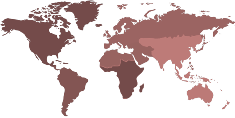
Şekil1: Dünyadaki Düşünce Kuruluşlarının Bölgelere ve Düşünce Kuruluşu Sayılarına Göre Küresel Dağılımı 2020