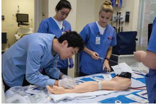
Şekil 2: Maket Üzerinde Eğitim