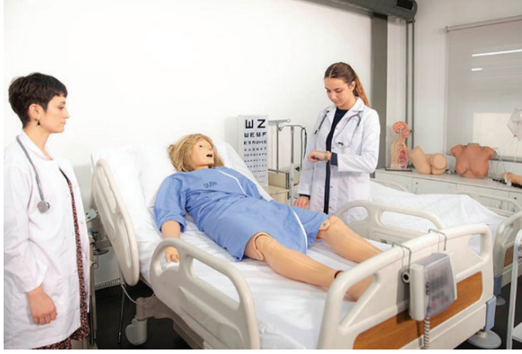
Şekil 1: Simülasyon Laboratuvarı